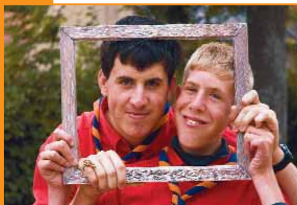
▲ Camp en Normandie Juillet 2005