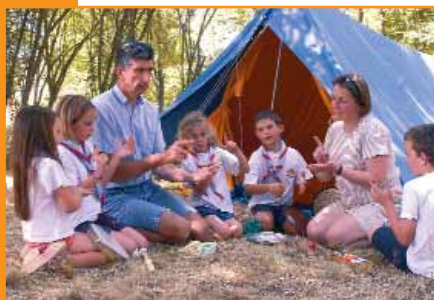
▲ Camp de Sarabandes d'Annonay Juillet 2004