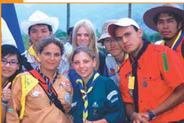
▲ Opération « Lumière de Bethléem » à Evry