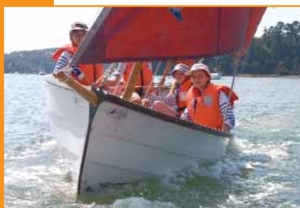
▲ Camp de mousset parisiens au Bonot Juillet 2005

Pour plus d'informations, vous pouvez prendre contact :